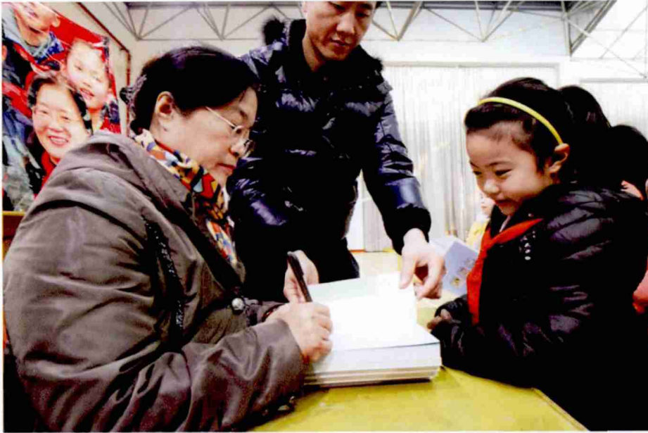
儿童文学作家 秦文君