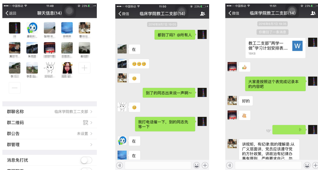
图1 教工二支部微信群及日常活动

1.党支部会要求每周开例会，但是作为临床工作者，工作繁忙，往往有一部分成员缺席，导致很多党员对支部工作不了解，支部开展工作不顺利，而“微信群”的建立，解决了诸多的问题，支部例会不再是每周的固定式，变成了平常的动态式。支部党员可以在“支部微信群”中随时随地进行讨论交流，发表意见，实现交流的零距离。