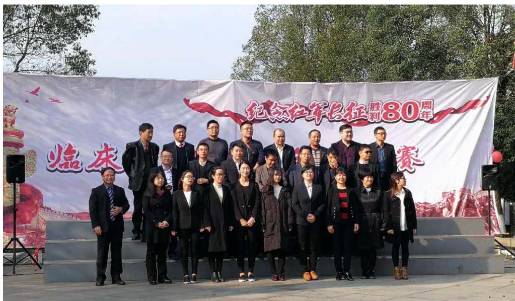
图6 纪念建党 95 周年暨红军长征胜利 80 周年红歌合唱

2.参加纪念建党 95 周年暨红军长征胜利 80 周年红歌合唱。通过红歌合唱，唤起全体党员的红色记忆，使大家得到艺术的享受的同时，弘扬民族精神，激发爱国热情，继承革命先辈们的优良传统。