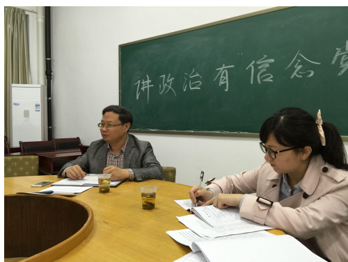
图3 多次开展线下活动

3.积极参加学校召开的基层党支部书记培训班，通过培训高度重视当前党支部的重点工作，发挥模范带头作用，认真贯彻落实会议精神，并向支部党员解读了党的基层组织工作条例，重点讲解了党组织的设置和职责，基层党支部换届选举的程序。