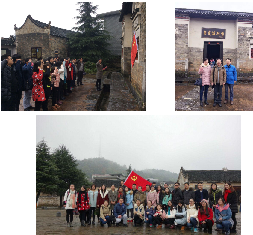
图5 开展革命传统教育活动

伟大情操。全体党员干部举行宣誓仪式，重温党的誓词，激发党员的爱国主义思想和爱国热情，增强了全体党员的民族自豪感，让不屈的民族精神深深扎根于全体党员的心中。