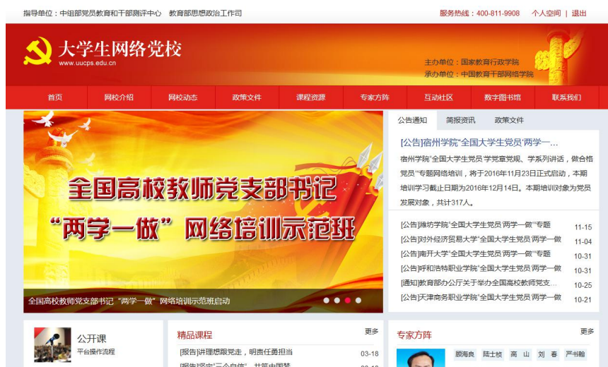
图2 全国高校教师党支部书记“两学一做”网络培训示范班