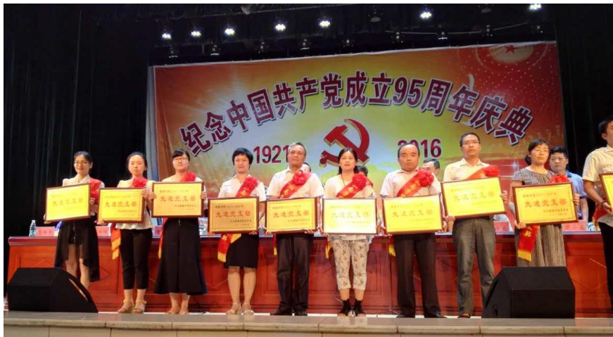
图 7 取得的成效

“两学一做”学习任重而道远，在这次教育培训活动的基础上我们要做到：一、继承，要继续保持良好的工作状态，积极进取再接再厉做好支部建设工作；二、创新，要在做好日常工作的基础上，从自身找原因，从本职工作找契机，创新创造性地开展工作；三、要丰富自己的知识结构、锻炼自己的工作能力，学有所成，劳有所获。同时让我们认识到在今后的工作中，要把开展“两学一做”学习教育与做好本职工作结合，以学习教育促进工作开展，以工作的成效来检验学习教育的成果。