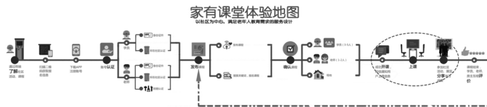
图1 家有课堂体验地图(绘图人:解雨点)

笔者针对重庆市社区老年教育的现状,设计了“社区老年教育的互助电子平台”。分为三个部分:老师、学生、资源整合者。整个课程是以学分制的方式为基础,课程设置为一小时一节课,每人每课10积分,一积分等于人民币一元,课程周期分化为1—3课时的短课程、5—8课时的中等时长课程与10—20课时的长课程。老年人课程结束可以通过成绩评定获得相应积分,学生课程结束达到较高水平则有资格成为教师开课,课程结束老师获得相应课程所得积分,获得总课程10%的积分可用来抵用课程积分。三者通过积分制形成一个以社区为依托的活性老年教育生态圈。针对具体设计流程与机制见图1—图3: