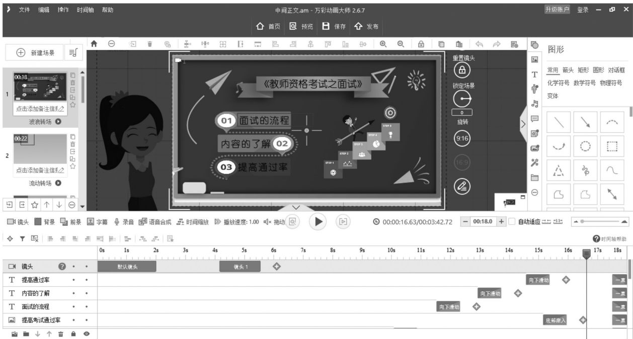
图 2 万彩动画大师制作界面

微课的制作方法一般包括屏幕录制法、动画软件制作法、教学拍摄法以及混合制作法。在教学过程中，一般采用动画软件制作法。动画软件制作法一般可以采用万彩动画大师、PPT、AE (Adobe After Effects)、Focusky 和优芽互动电影等软件。本研究主要选用了万彩动画大师、AE 以及 PPT 制作微课。例如，在《教师资格证考试之面试》微课中，片头采用 PPT 动画设计动感的画面，正文和片尾均采用万彩动画大师进行制作，如图 2 所示。在微课的配音上，采用专业人员的声音进行配音。在视频剪辑方面，笔者选用 PR (Adobe Premiere Pro CC 2015) 进行视频剪辑与渲染。