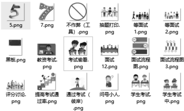
图 1 《教师资格证考试之面试》微课的图片素材

要的素材以及文字资料等。一般的微课画面讲究图文并茂，所以收集图片资源和字体资源是必然的。当然，在一个微课中不仅仅是用图片和文字，还需要用对应的音频、特效、视频以及背景音乐等资源。在制作微课时，要确保微课画面清晰，同理，在选择图片时也要选择高清图，这样能更加体现出微课的高质量。所以在选择下载高清图时，笔者建议去专业的图片素材网站下载，如觅元素、千图网、六图网、包图网、摄图网等。这几个网站最大的优势就是可以下载 PNG 的图片格式，且不需要再进行抠图工作，在一定程度上减少了工作量，且下载的图片可以直接使用。下载后的 PNG 图片，可以对其命名后放置在新的文件夹中，方便查找与使用，如图 1 所示。