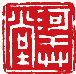
清 高凤翰 河干草堂