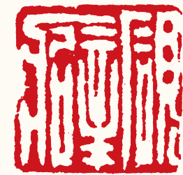
清 高凤翰 砚癖

意期间，这一时期高凤翰的篆刻创作达到了极高的艺术高度。在第一时期大量收集古代玺印的基础上，印宗秦汉的篆刻学习打下了深刻的篆刻基础，加之第二时期中充分汲取了『印外』的营养，这使得高凤翰在这一时期的创作更加『得心应手』。他于《南阜山人文存稿》中曰：『余近学得篆印，一以《印统》及所收汉铜旧章为师。觉向来南北所见士大夫名手，皆有习气。故近与刻家论印，每以洗去图书