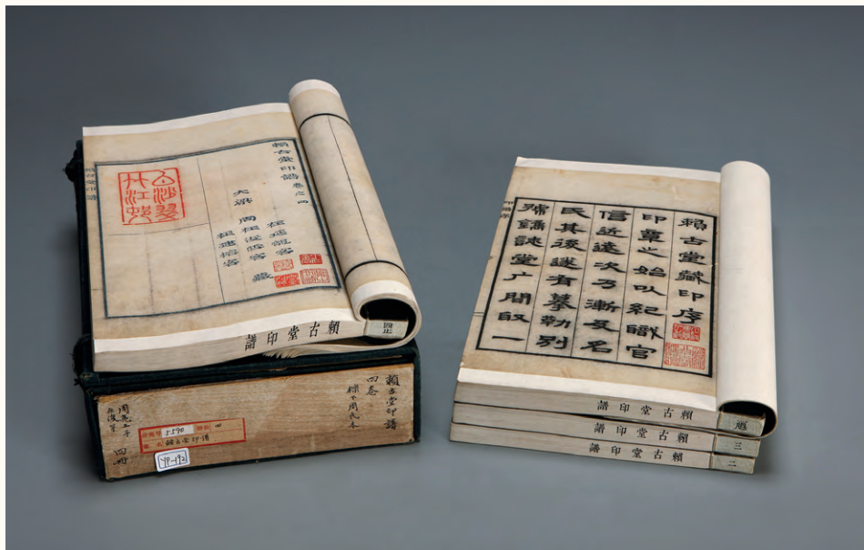
周亮工编选《赖古堂印谱》书影，西泠印社藏

其中便是以张氏家族印人的崛起为标志。从技法风格上说，张氏家族印人兼收当时江南流派风格之长，印章风格平实清雅，圆润温妍，秀美雅健。刀法上以切刀为主，刀刀行进距离较短。线条粗细相当，布局安排工稳，线与线之间安排均等，破残之处少，做印效果不明显，属工稳平实一路印风。在周亮工的提携下，张贞和他的儿子形成的这股印风在山东风靡一时，同在山东的高凤翰自然受到这股印风的影响。明清时期安丘的『安丘印派』成为江北极为重要的印派。其中以张贞及其三个儿子即张在辛、张在戊、张在乙为代表。由此不难看出