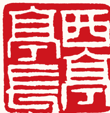
清 高凤翰 西亭亭长