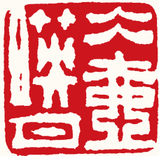
清 高凤翰 冰壶映月