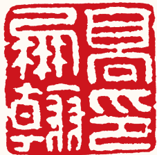
清 高凤翰 高凤翰印