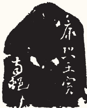
清 高凤翰 家在齐鲁之间