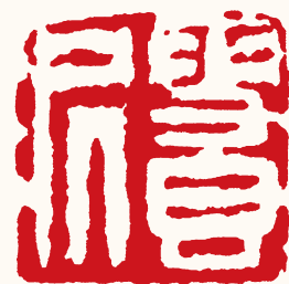
清 高凤翰 雪香居