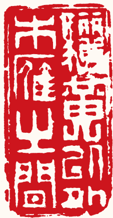
清 高凤翰 骊黄以外木雁之间