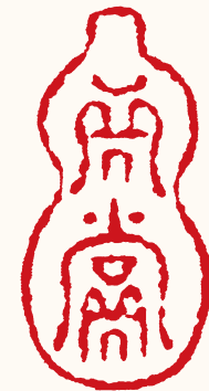
清 高凤翰 真赏