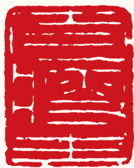
清 高凤翰 大瘦生