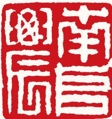
清 高凤翰 南阜农

村庄鉴定。乙卯(二七三五)高西园赠朱客亭藏。再题引首:要使金石生肺腑。石道人题。桐君所得金石、桐君、桐君鉴后、陈桐君及其他藏印合共二十。足见高凤翰对于秦汉玺印收集的喜爱 ⑤ 。 现可见印谱有《南邨印辑》《高西园先生金石印存》《高凤翰印谱》等,其中秦汉玺印、战国古玺均有涉猎,官印、私印,钮式均有记载,有记云曰:合之,凡官印九,私印四,杂印十有五。又记载了印章的钮式:其印有龟钮者、辟邪钮者、小龙虎钮、兽钮、亭钮、鼻钮、带钩、两面印等二十八方。由此可见高凤翰对秦汉印的整理和对印章形式构成的研究已较为深入,对于印章整理和印史研究做了工作。由秦汉印的收藏研究而生发出来的是高凤翰对篆刻学习的新认